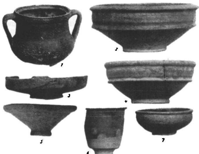
Fig. 5. Ceramică romană (sec. II—IV).