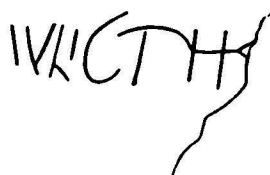
Fig. 3. Inscripție pe un tipar de argilă.

15. Bază fragmentară din marmură de la o statueta a Hygiei, înaltă de 0,10 m, lată de 0,125 m și cu litere înalte de 0,008—0,013 m. Descoperită de locuitorul Ion S. Tudor. Din elementul sculptural se păstrează poala hainei cu picioarele zeiței și alături un altăraș