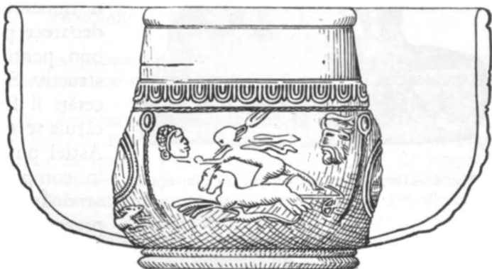
Fig. 4. Vas terra sigillata .